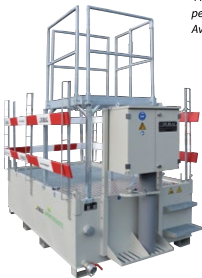
4 m 3 , parfait pour les petits chantiers. Avec BigBag et plateforme

Laver et neutraliser l'eau des chantiers n'est pas seulement une obligation, mais aussi une contribution judicieuse à la protection de l'environnement. Notre vaste gamme de protection des eaux vous accompagne avec une variété de bassins de décantation et de neutralisation combinés spécialement développés, allant de 0,3 à 20 m 3 . Ces bassins sont complétés par des installations de neutralisation automatique et de commutation de gaz, des mesures de turbidité et d'autres accessoires pour un traitement de l'eau simple et efficace.