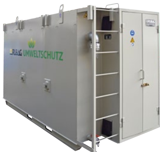
Ce bassin avec un volume de 10 m 3 et une armoire intégrée pour le système d'injection de gaz CO 2 et technique offre une solution compacte.

* Prix d'action: Bassin de 4 m 3 inclus coffret de neutralisation d'une valeur de Fr. 1'590.-