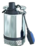
Pompe à eaux usées J4W