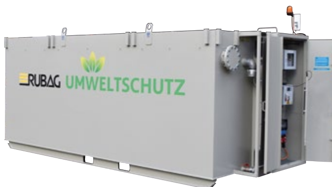
Nous recommandons pour les grands volumes d'eau nos bassins de 20 m 3 . Avec armoire intégrée pour le système d'injection de gaz CO 2 et technique. Rehausse de lavage en option.