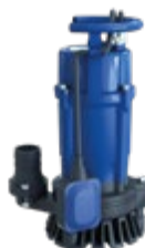
Pompe à boue JS7W