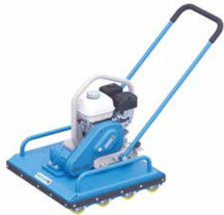
Rollenrüttler (Breite 420 - 670 mm)