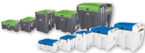
Kunststoff-Behälter von 60 - 9'000 l