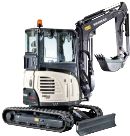
Mini- und Kurzheckbagger (1 - 5 t)