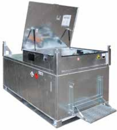
mobile Tankanlagen IBC (100 - 3000 l)