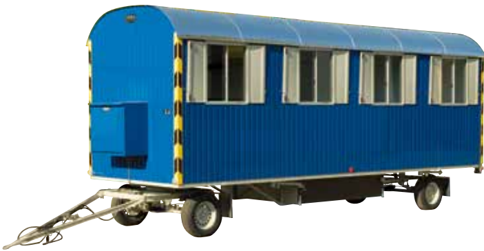
2-Achs Baustellenwagen (6 - 8 m)