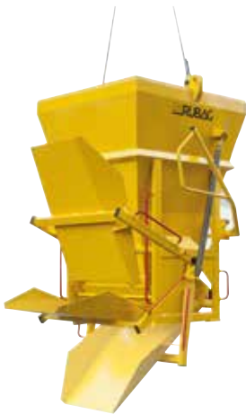
Betonkübel (Volumen 250 - 2000 l)