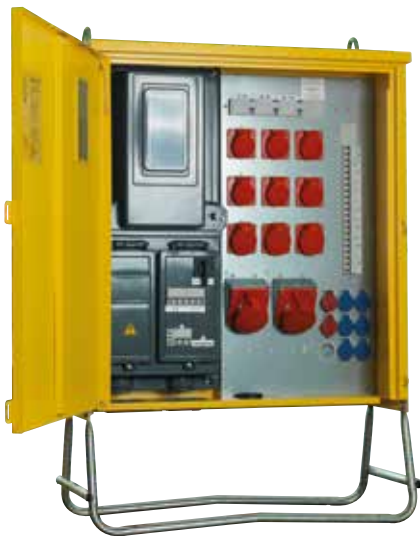
RUBAG Baustromverteiler (nach Kundenwunsch)