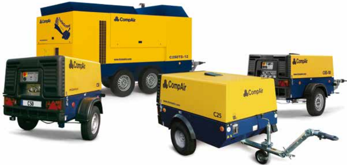
Kompressoren (Leistung 2 - 27 m 3 /Min., Betriebsdruck bis zu 24 Bar)