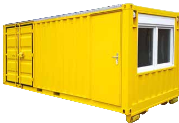
Abroll-Kombi-Container (20 Fuss)