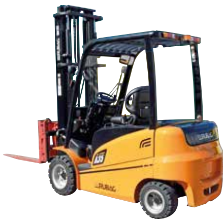
Gabelstapler mit Elektro- oder Verbrennungsmotor (Tragkraft 1.5 - 10 t)