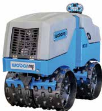
Grabenwalzen (1400 kg)