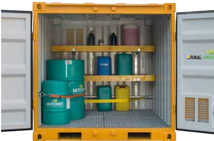
Gefahrgut-Container (Volumen 2 - 60 m 3 )