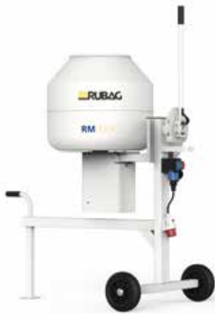
RUBAG Betonmischer (Volumen 100 - 150 l)