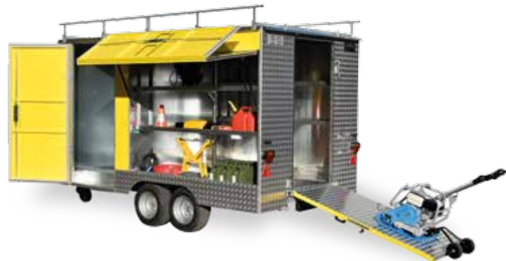
1- und 2-Achs-Geräteanhänger (bis 3.5 t GG)