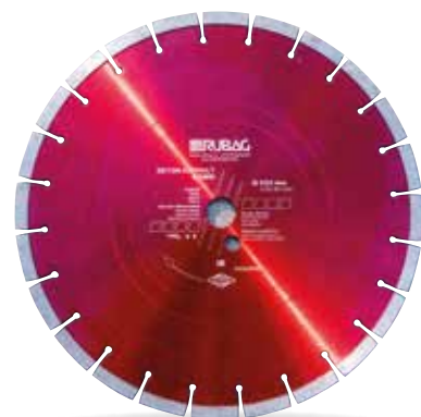
Diamantscheiben (Ø 50 - 1600 mm)