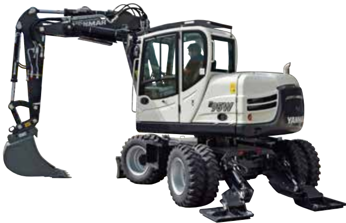
Mobilbagger (7 - 13 t)