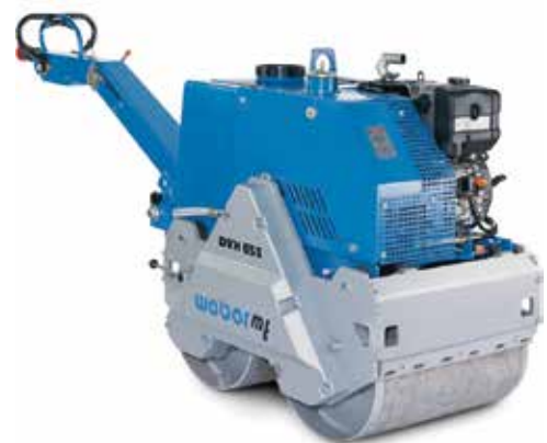
Doppelrollenwalzen (330 - 750 kg)