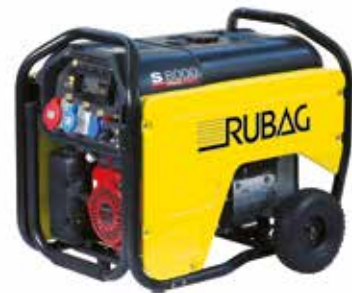
PRAMAC Stromerzeuger (Leistung 1 - 3500 kW)