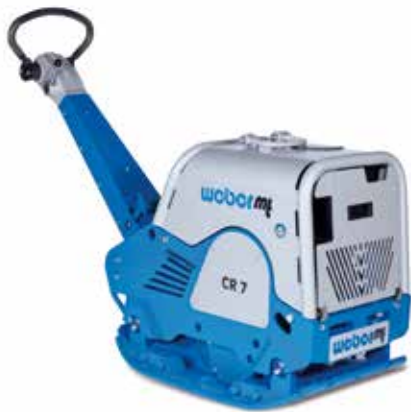
Reversierbare Vibrationsplatten (100 - 750 kg)