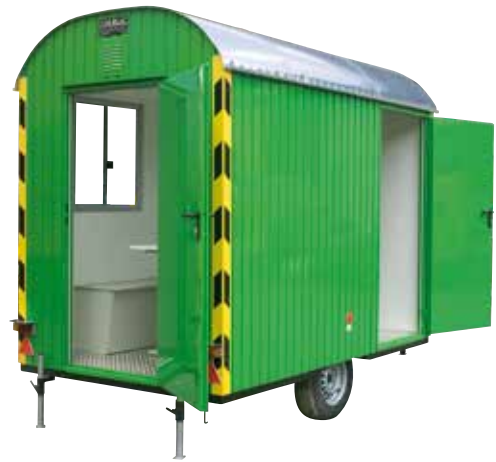
Magazinwagen (2.5 - 3.5 m)