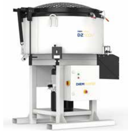
RUBAG Zwangsmischer (Volumen 100 - 1050 l)