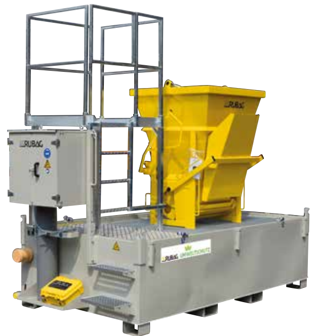
Kombi-Waschbecken und Kombi-Absetzbecken (3.5 - 10 m 3 )