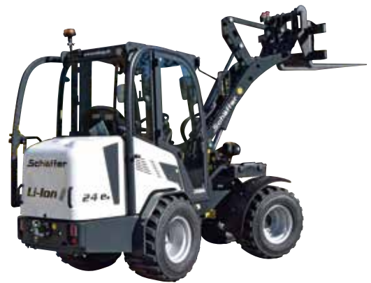
Radlader und Teleskop-Radlader (1.8 - 13 t)