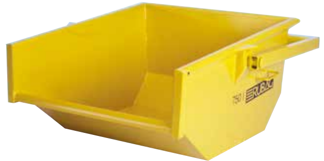
Aushubkübel (Volumen 350 - 3000 l)