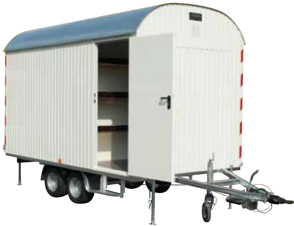
1-Achs und Tandem-Baustellenwagen (3 - 5 m)