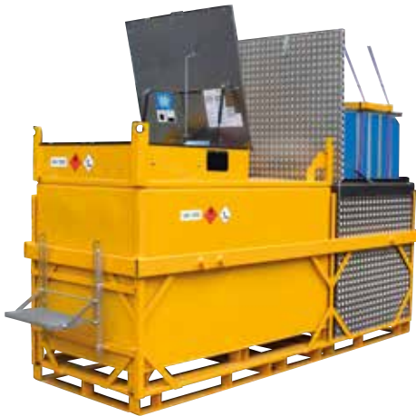
Kombi-Variante (Diesel und AdBlue®)