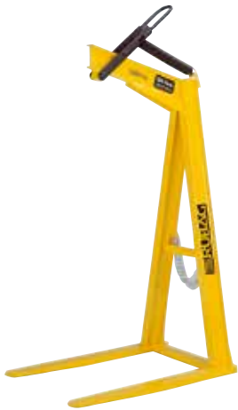
Palettgabeln (Tragkraft 1800 - 3000 kg)