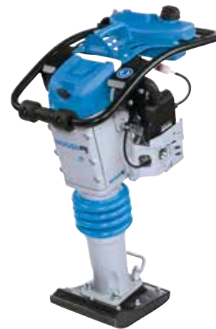
Grabenstamper (55 - 80 kg)