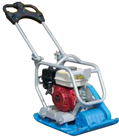
Einweg-Vibrationsplatten (60 - 130 kg)