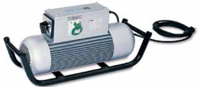
weberm Elektrische Umformer (2.7 - 4.0 kVA)