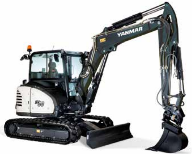
Midi- und Kurzheckbagger (5 - 12 t)