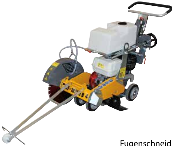
Fugenschneider (Schneidtiefe 0 - 480 mm)