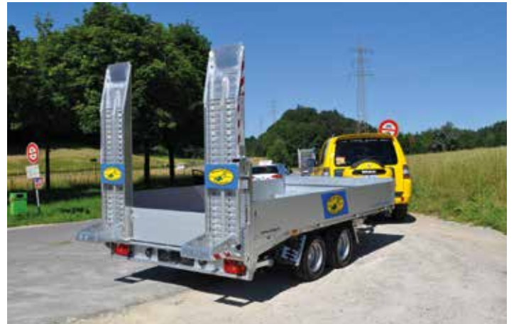
Transportanhänger (Gesamtgewicht bis 3.5 t)