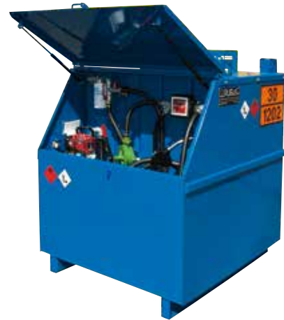
CH-Baustellentank (400 - 20'000 l)