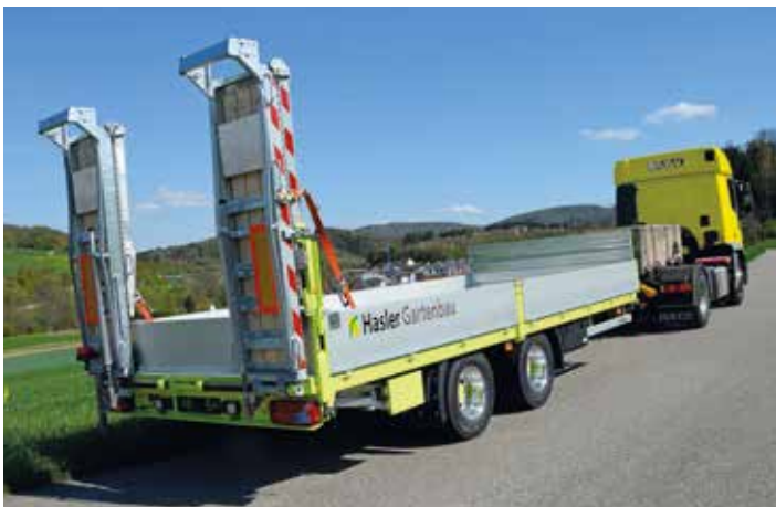
Lastwagenanhänger (ab 3.5 t Gesamtgewicht)