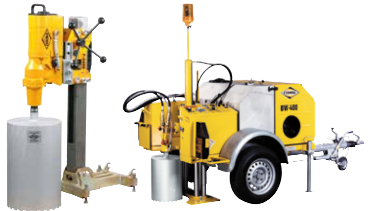
Bohrständer und Bohrwagen (max. Bohr-Ø 20 - 1200 mm)