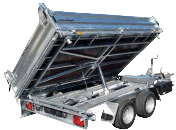
Kippanhänger (bis 34 t GG)