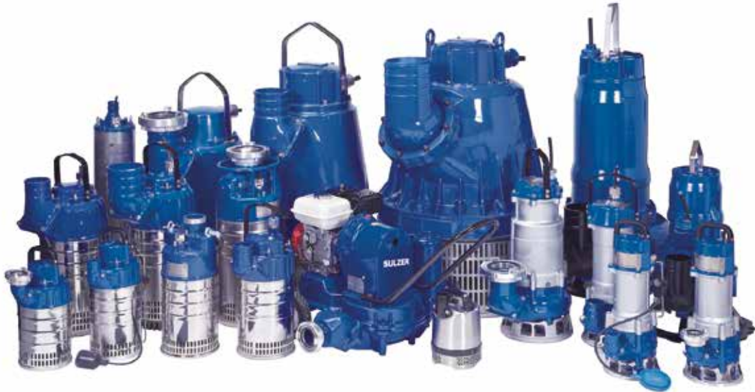
Schmutzwasser-, Schlamm und Fäkalienpumpen (150 - 20'000 Liter/Min.)